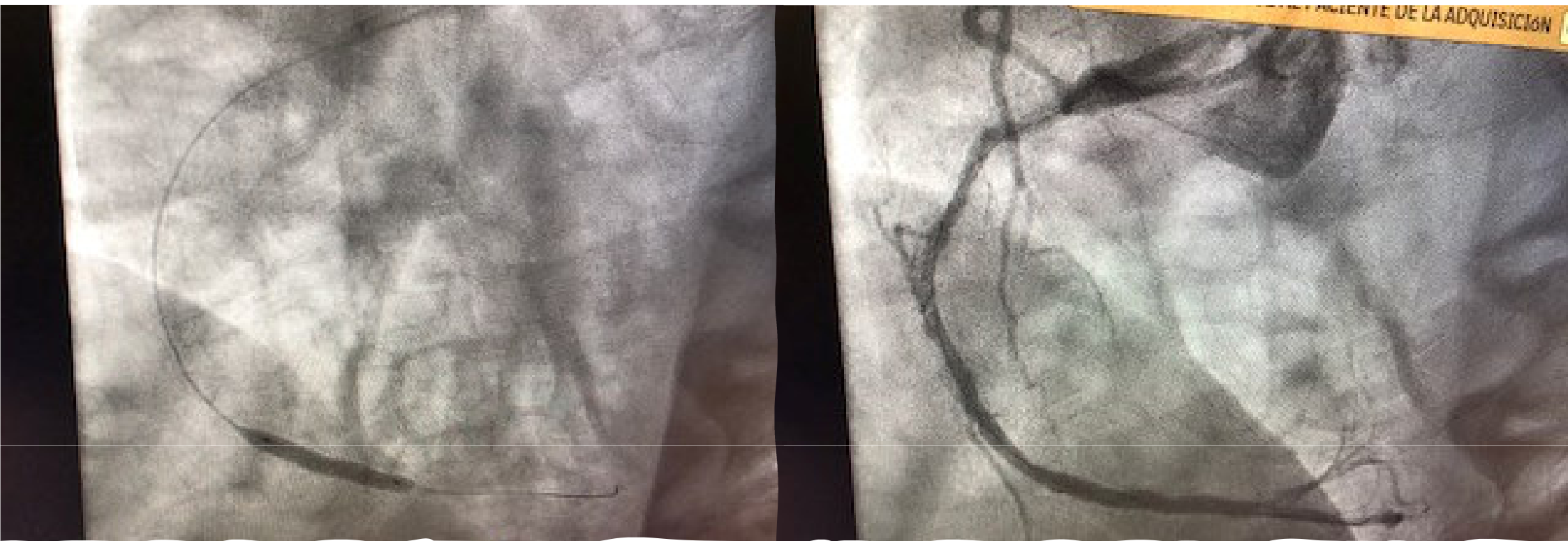
Implante de stent farmacoactivo (Orsiro 2,5x22mm)